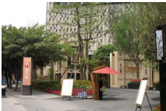
中国成都市（望今縁）