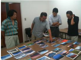
審査（ポर्टレートギャラリー：東京四谷）

総入場者数 日本山梨・静岡・中国四川省成都市・眉山市 55 日間 計 12,830 名