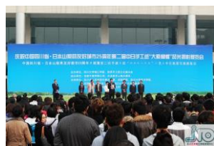
中国眉山市（四川大学錦江学院）