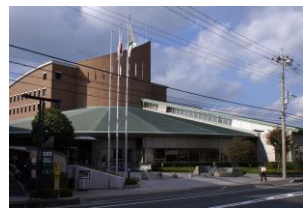
静岡県（富士市中央図書館）