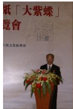
在重慶元日本国総領事瀬野様ご祝辞