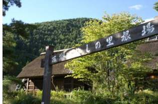
山梨県（西湖いやしの里 根場）