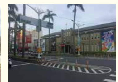
屏東県美術館(予定)