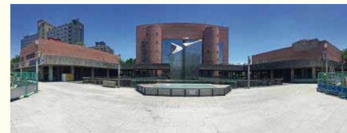
台南市永華文化中心