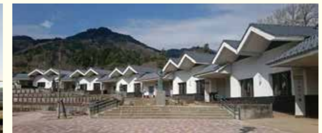
山梨県道の駅みのぶ富士川観光センター