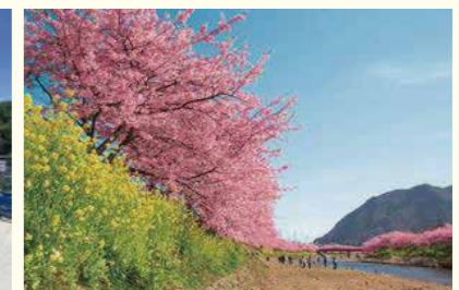
静岡県伊豆の地で予定