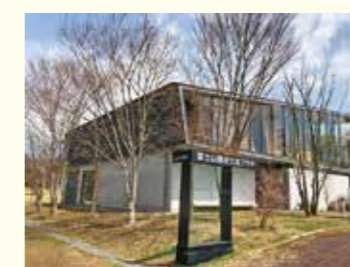
富士山環境交流プラザ